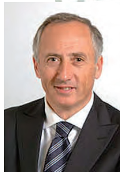
Il senatore del Pdl Filippo Saltamartini

L n effetti non si capiva bene che cosa c'entrassero le parafarmacie con un Disegno di legge sui lavori usuranti. In ogni caso il relatore al Senato del Ddl in questione, Filippo Saltamartini (Pdl) ha ritirato i suoi emendamenti. Uno di essi prevedeva che entro dieci anni si concludesse l'esperienza delle parafarmacie e venisse invece consentito ad alcuni esercizi commerciali di vendere una ristretta lista di Otc. Argomenti spinosi che meritano una trattazione ad hoc nei progetti di riforma del servizio farmaceutico in discussione in Parlamento, primo fra tutti il Gasparri-Tomassini.