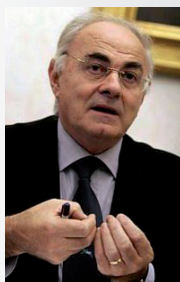
Il senatore Elio Lannutti

Colpo di grazia sull'ipotesi di istituire farmacie non convenzionate. Così pare almeno in seguito al ritiro del Disegno di legge presentato un anno fa dal senatore dell'Italia dei valori Elio Lannutti. In pratica il progetto intendeva procedere a una riforma del servizio farmaceutico introducendo la novità rivoluzionaria di cui sopra. In compenso l'Idv ha presentato un nuovo Disegno di legge - a firma dei senatori, Astore, Belisario, Carlino e Mascitelli - nel quale il riordino del settore appare in sintonia nelle linee generali, con altri progetti già all'esame del Parlamento.